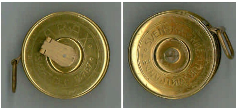
Bild: vänster respektive höger sida av kreatursviktbandet ARAX. Dess övriga sida kröker sig runt dosan och är mycket svår att fotografera.