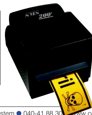
Dekal-skrivare SMS 200