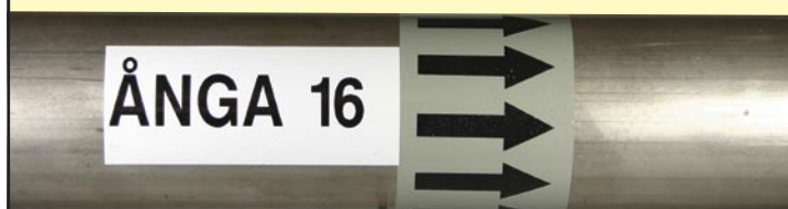
Exempel på piltejp och enkel textdekal, tryckt på en HandiMark. Se bild till höger nedan.